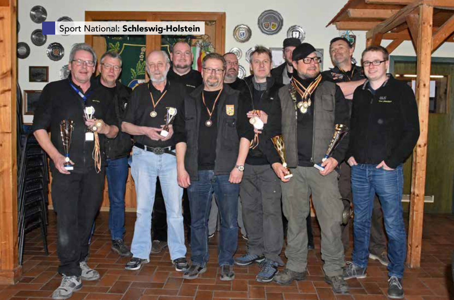
Unser Team beim Dreikönigspokal 2020.