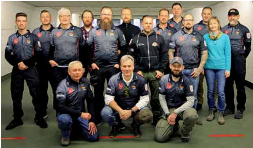
Hinter jedem Wettkampf stehen viele engagierte und fleißige Helfer: Das Orga-Team der SLG Roland Bremen.

Aufgrund der mehr als positiven Resonanz sollte man sich unbedingt den 28. November 2020 merken und sofort im Kalender eintragen – auch der Samstag vor dem 1. Advent im nächsten Jahr wird im Zeichen des Schießsports stehen!