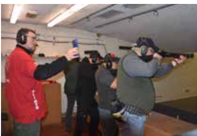
PP1 mit der Flinte.