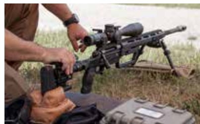
Endlich beginnt das Training, auf das sich alle akribisch vorbereitet haben!

Bestandteil ihres Alltags: Munster ist der größte Standort des Deutschen Heeres und der viertgrößte Standort der Bundeswehr überhaupt. Die umfangreichen und oftmals geräuschintensiven Aktivitäten auf den drei benachbarten Truppenübungsplätzen MUNSTER-NORD und -SÜD und BERGEN, im nahen Standort