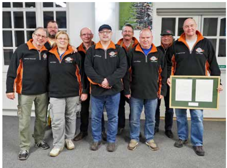
Das erfolgreiche Team BDMP in Bisley.