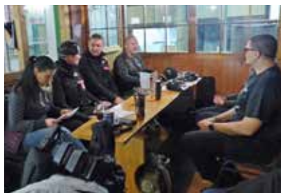
Gute Freunde in der Königsloge.