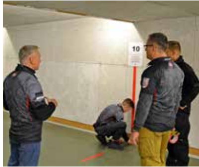
Allerletzte Vorbereitungen und Absprachen, bevor der Wettkampf beginnt.

Motiviert wurde geplant und organisiert, es wurden Helfer gefunden