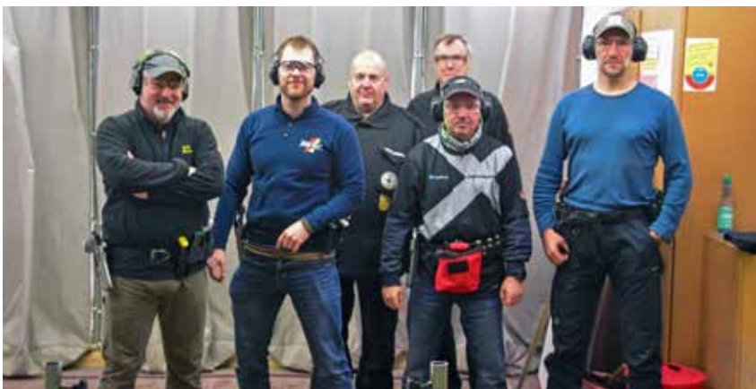
Ohne Stress und mit Spaß – so soll es sein.