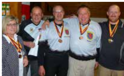
Genauso wie der Bundesreferent PP1 bei der Siegerehrung.

So konnten wir mit der Siegerehrung um 19.00 Uhr beginnen. Der Saal im Schützenhaus war voll besetzt, fast alle Erstplatzierten konnten persönlich ihre Medaillen entgegen nehmen.