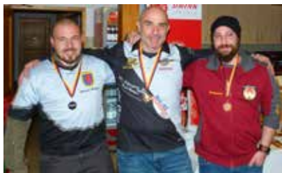
Neue Schützen nahmen auch erfolgreich an der Veranstaltung teil und hatte ihren Spaß.

Am Freitag begann der Wettkampf um 12:00 Uhr. Es waren keine freien Startplätze mehr vorhanden. Da