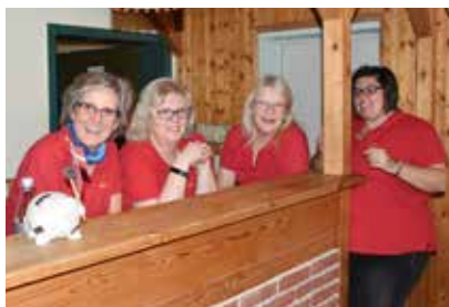
Ohne unsere Mädels geht nichts.