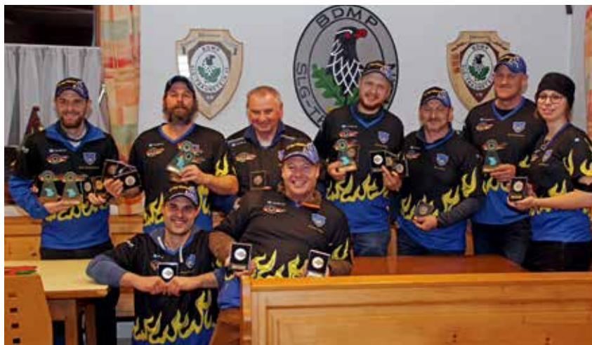
Die SLG Bad Wiessee.

■ Text und Fotos: Andreas Mayer Landesreferent PP1/3/4/NPA/SM1 Bayern Süd