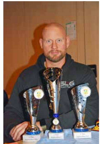
Die begehrten Pokale.