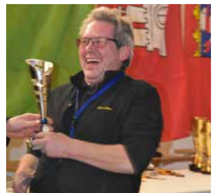
Oder auch Freude pur.