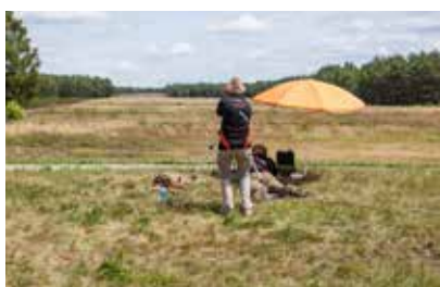
Idealerweise schießt man im Team und berät und bespricht sich kameradschaftlich.