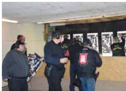
SLG Hafen Hamburg e.V. im neuen Outfit.