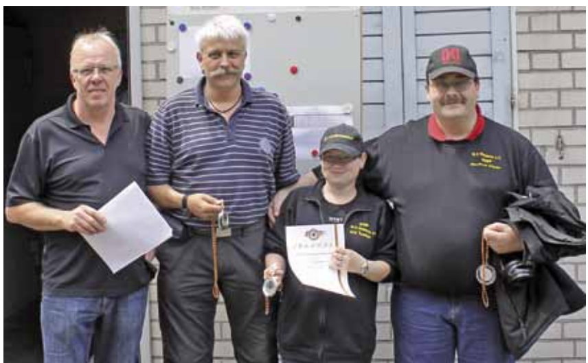
Den zweiten Platz in der Teamwertung holte sich die SLG Wetterau 2.