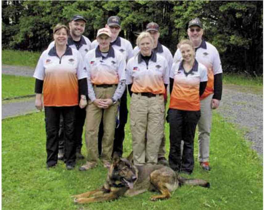
Das PPC 1500 Organisationsteam mit Schäferhund Malto.

die ersten drei Schützen ein „Kopf an Kopfrennen“, bei der dann letztendlich die Anzahl der Xer über die Platzierungen entschied. Deutscher Meister mit 1484 von 1500 möglichen