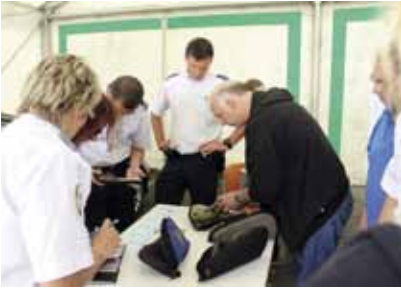
Eine langwierige und zeitraubende Kontrolle am französischen Zoll. Wird die Fähre warten?

1000 km Autofahrt, aufgrund Regens in Frankreich größtenteils mit 110 km/h, im Hotel Kräfte zu sammeln um am morgigen ersten und einzigen Trainingstag ausgeruht trainieren zu können. Leider fand auf der Schießanlage ab Mittag ein Match im Rahmen einer IPSC-Veranstaltung statt, weshalb das Training ungewohnt kurz ausfiel. So mussten wir uns eine Beschäftigung für den Nachmittag suchen, und es bot sich ein Besuch bei der Jersey Battle of Flowers an, die zufälligerweise an diesem Donnerstag Nachmittag auf der Hauptstraße in Saint Helier stattfand. Da das Wetter mitspielte war es etwas ganz