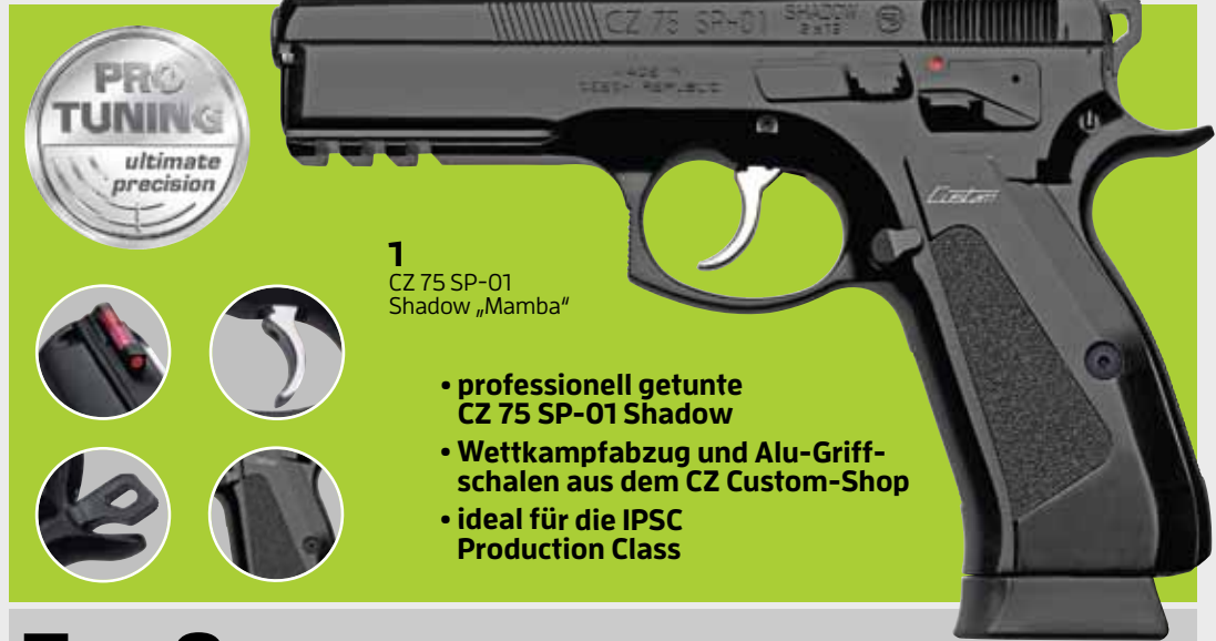
1 CZ 75 SP-01 Shadow „Mamba“