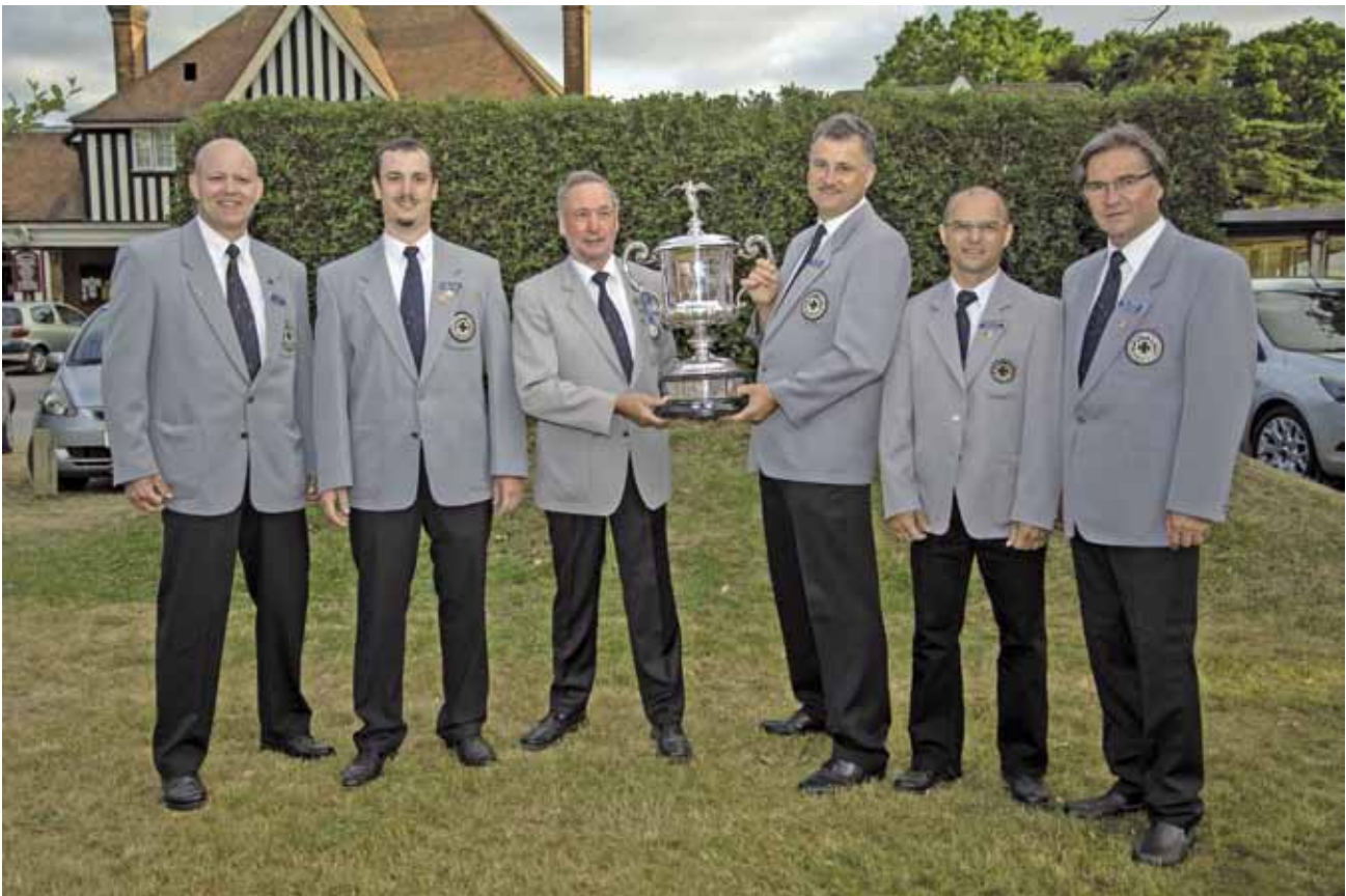
Das BDMP Target Rifle-Team.