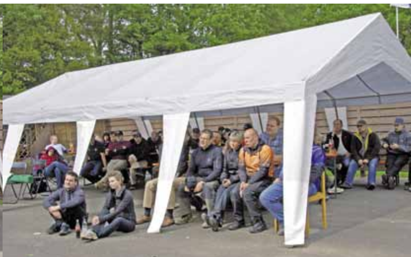
Das eigens für diesen Anlass errichtete Zelt war bei den Schützen sehr beliebt, bietet es doch viel Raum für gute Gespräche mit Schützen die man nicht alle Tage sieht.