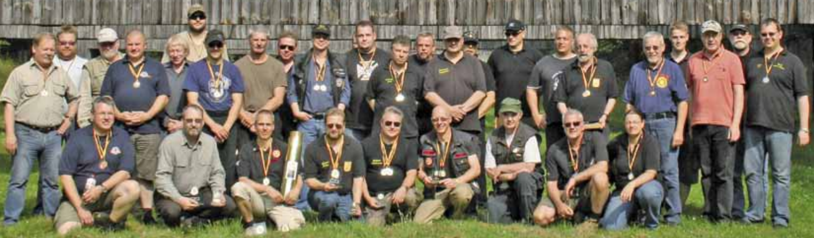
Unsere Teilnehmer blieben alle bis zum Gruppenfoto, dafür Danke!