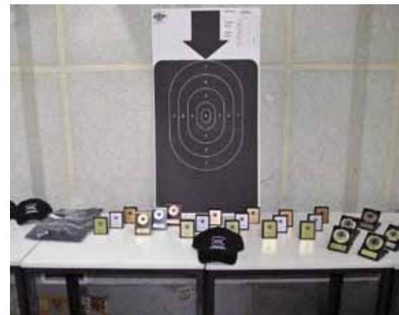
Die Medallien und Präsente für die Gewinner.

Baseballkappen, Kugelschreibern und anderen Werbegeschenken. Die Ausrichter bedanken sich an dieser Stelle