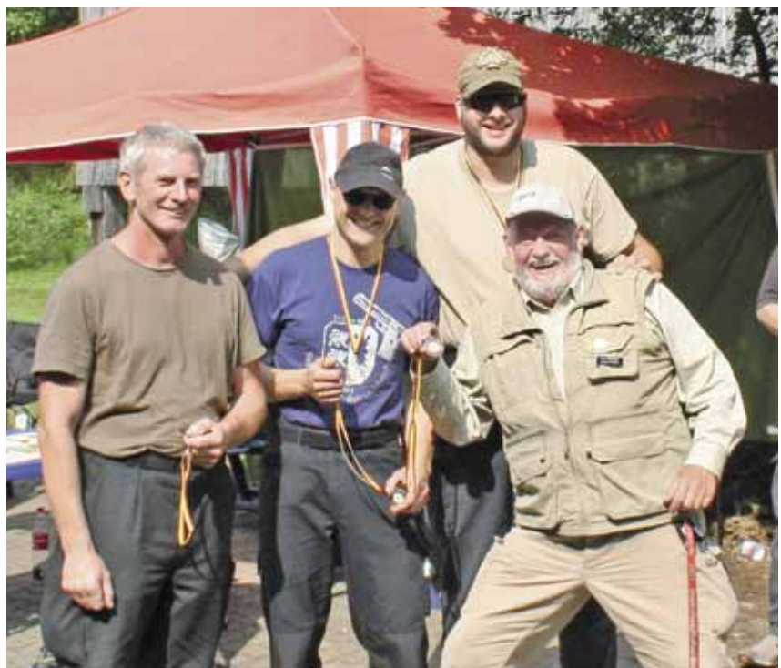
Große Freude beim Team Nord über den 3. Platz Mannschaft bei ZG1 Mod.