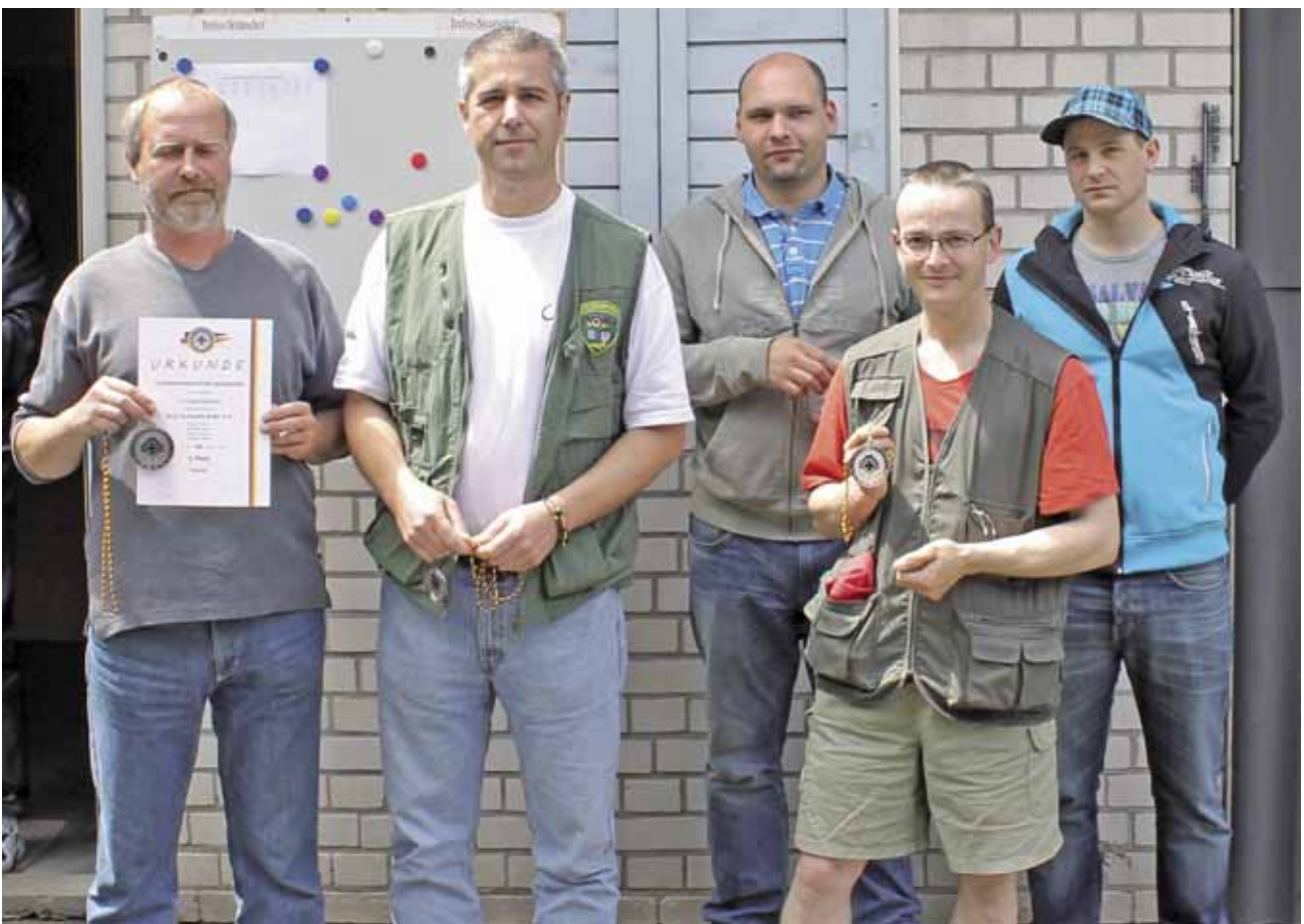
Die SLG Schwalm-Eder erreichte den 3. Platz der Teamwertung.