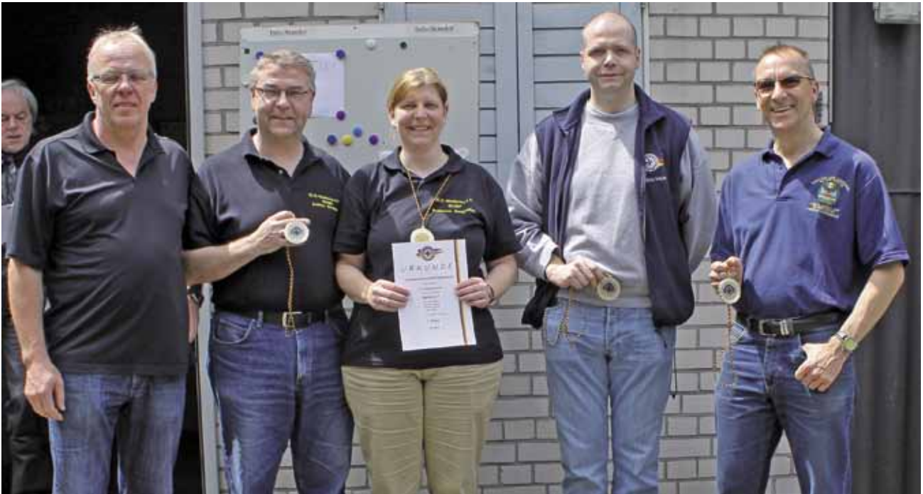
Die SLG Wetterau 1 belegte Platz 1 in der Teamwertung.